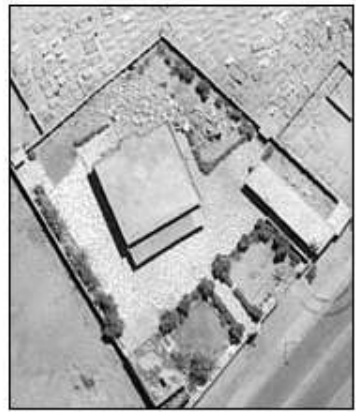
The U.S. military provided this before, above, and after image that shows where American helicopter gunships and tanks fired at a mosque in Falluja and toppled its minaret on Monday.