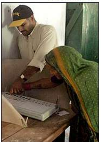
Santosh Verma for The New York Times